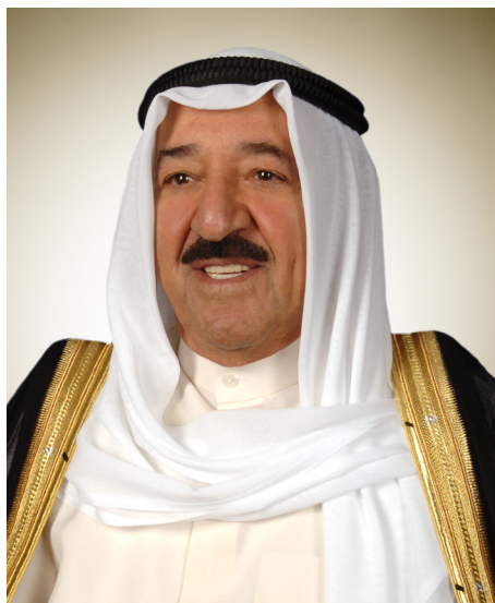
صاحب السمو الشيخ صباح الأحمد الجابر الصباح أمير دولة الكويت