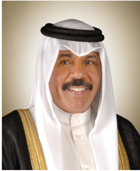
سمو الشيخ نواف أحمد الجابر الصباح ولي عهد دولة الكويت